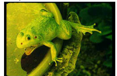
© Rosalind Nashashibi – Lux .